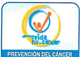
PREVENCIÓN DEL CÁNCER