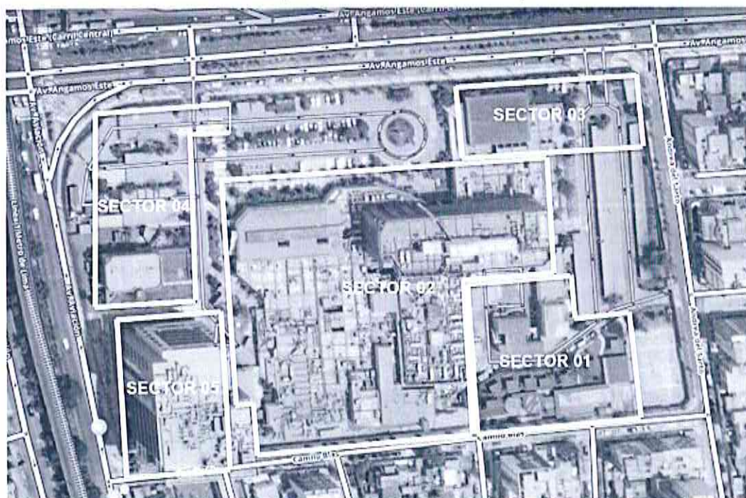
Gráfico N°02: Mapa de división del INEN por Sectores