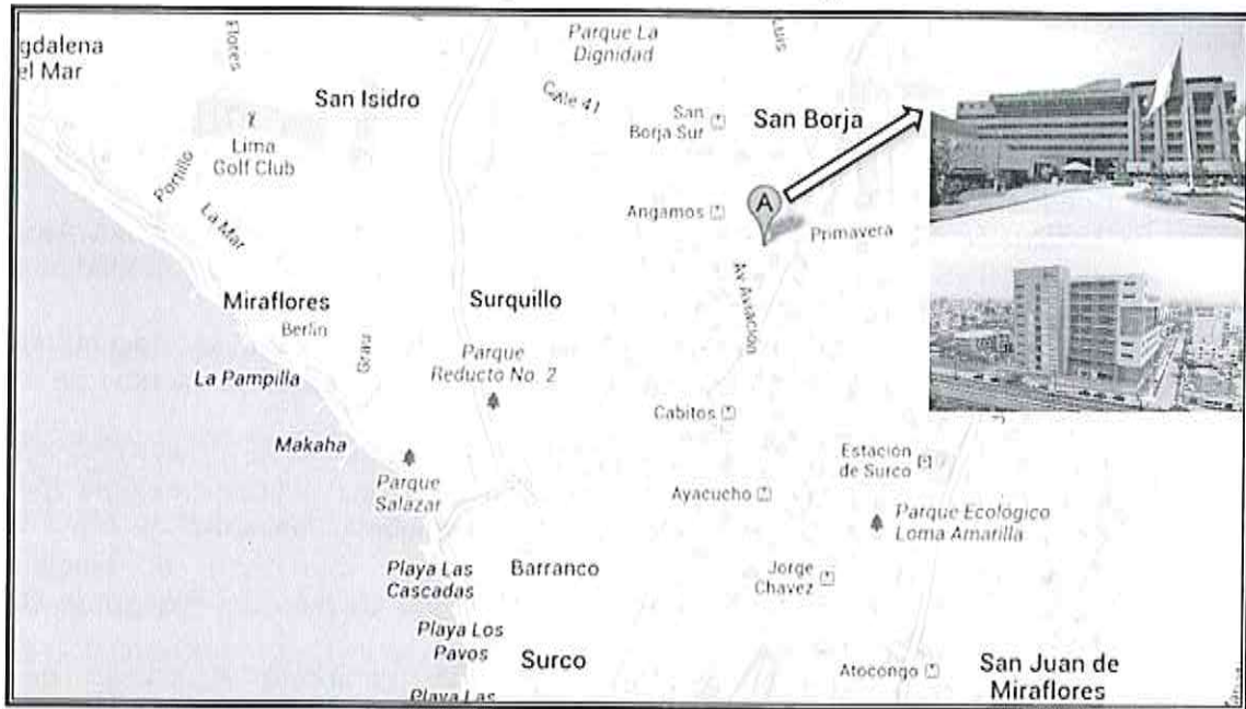
Gráfico N°01: Mapa de Ubicación Geográfica - INEN

"DECENIO DE LA IGUALDAD DE OPORTUNIDADES PARA MUJERES Y HOMBRES" "AÑO DEL BICENTENARIO, DE LA CONSOLIDACIÓN DE NUESTRA INDEPENDENCIA, Y DE LA CONMEMORACIÓN DE LAS HEROICAS BATALLAS DE JUNÍN Y AYACUCHO"