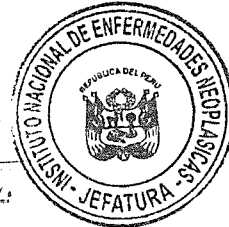
MG. FRANCISCO E.M. BERROSPÍ ESPINOSA Jefe Institucional Instituto Nacional de Enfermedades Neoplásicas